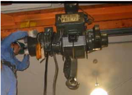
天井クレーン点検中写真

つり上げ荷重が0.5トン以上のロープホイストまたは電気チェーンブロックを使用する場合は、クレーン等安全規則(労働省令第34条～36条)の規定により、 事業者 に 定期点検自主検査(月次点検・年次点検) が義務付けられています。定期自主検査を実施するための資格や免許は特別定められていませんが、弊社では日本クレーン協会が実施する『天井クレーンの定期自主検査者に対する安全教育』を修了したサービスマンが点検に従事しています。日本クレーン協会の統計によりますと、平成23年度のクレーン等による死傷災害者数は1,799人(内数:全産業での死亡者=67人、内製造業=25人)、1日当たり約5人と多発しています。安全な作業と設備保全のために、 お客様のご依頼により点検を代行します 。点検に困った際には、弊社担当者に気軽に声をかけて下さい。