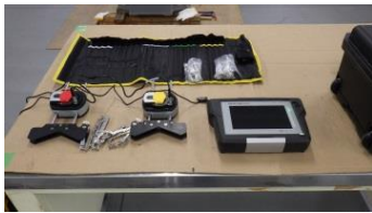
レーザー芯出し機

大切な生産設備をより長く稼働させる為には、正確な芯出しが必要です。特に中間軸の長い継手や通常より高い精度が要求される場合に、有効な【レーザー式芯出し器】でお手伝い致します。お気軽にご相談ください。