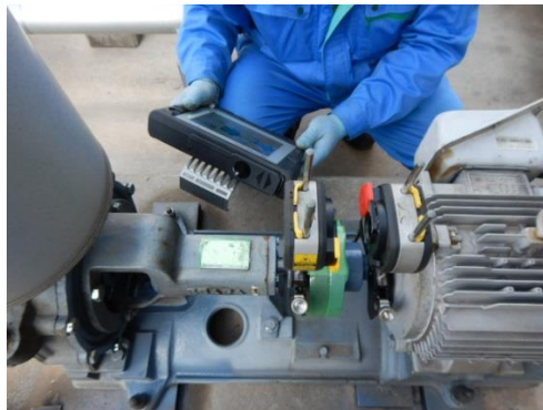
弊社技術員芯出し作業